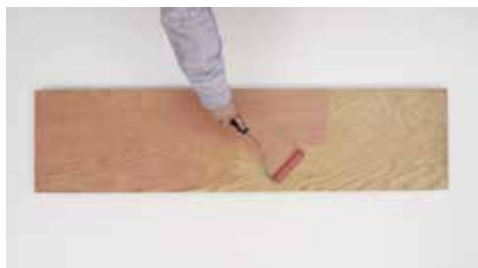
Προετοιμασία με Keragrip Eco