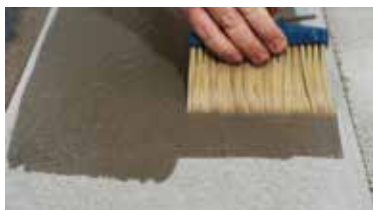
ΣΚΥΡΟΔΕΜΑ επαλήθευση της απορροφητικότητας