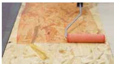
ΞΥΛΙΝΑ ΠΑΝΕΛ Keragrip Eco

Το H40® Τζελ-Συγκολλητικό Υλικό είναι το πρώτο και μοναδικό "όλα-σε-ένα" προϊόν γιατί είναι κατάλληλο για όλα και πάνω σε όλα.