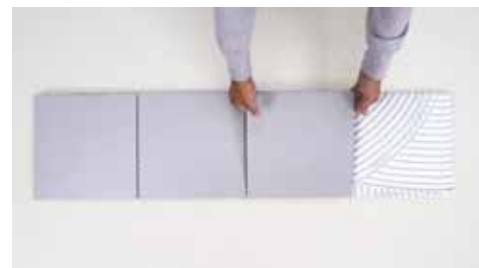
Τοποθέτηση του πλακιδίου

Το H40 ® Gel No Limits ® αντέχει τις καταπονήσεις των πιο παραμορφώσιμων υποστρωμάτων, χάρη στην υψηλή αντοχή στις διατμητικές τάσεις, που δίνουν οι νέες και αποκλειστικές ρητίνες με χαμηλές περιβαλλοντικές επιπτώσεις.