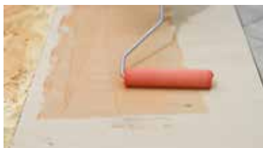
ΔΑΠΕΔΑ PVC (ΒΙΝΥΛΙΚΑ) Keragrip Eco