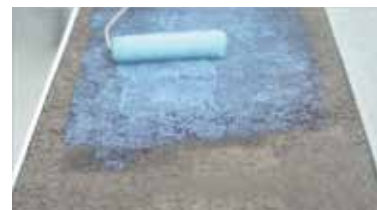
ΤΣΙΜΕΝΤΟΚΟΝΙΑ Primer A