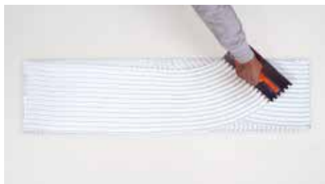
Άπλωμα του H40 ®