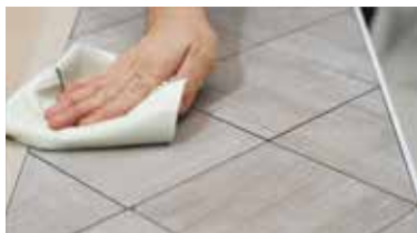
ΚΕΡΑΜΙΚΑ ΠΛΑΚΙΔΙΑ καθαρισμός και στέγνωμα