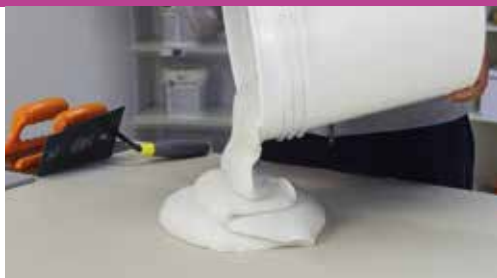
Μίγμα Θιξοτροπικό και Ρευστό