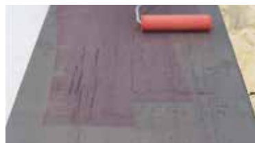
ΜΕΤΑΛΛΟ Keragrip Eco