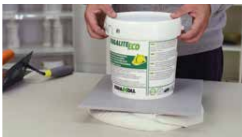
Συγκρατεί το πλακίδιο